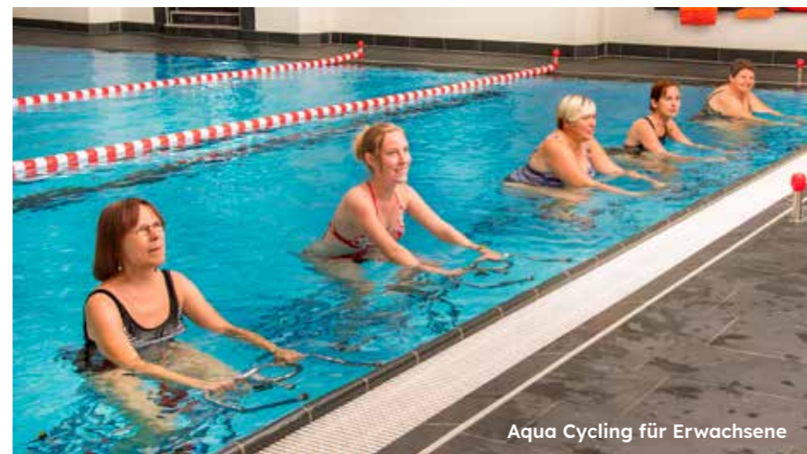
Aqua Cycling für Erwachsene

Angefangen bei den Kleinsten zählte die Altmühltherme innerhalb eines Jahres rund 450 Kinder mit einem Elternteil in den Kursen Babyschwimmen, Kleinkindschwimmen (ab 1 Jahr) und Wassergewöhnung (ab 3 Jahren).