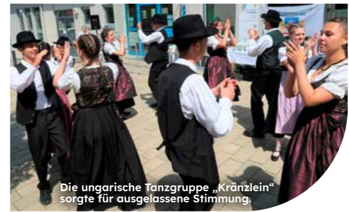
Die ungarische Tanzgruppe „Kränzlein“ sorgte für ausgelassene Stimmung.