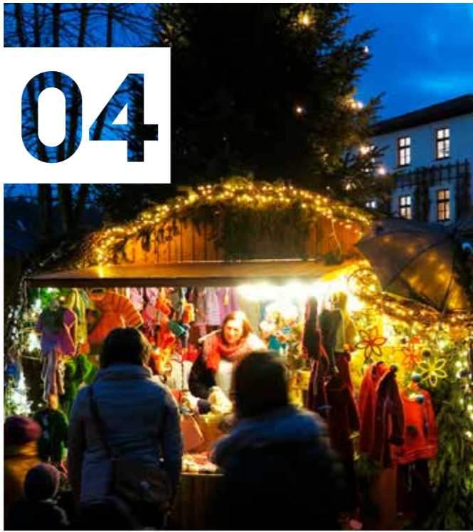
Nach zwei-jähriger Pause bringt die Schlossweihnacht heuer wieder weihnachtliche Stimmung in die Stadt.