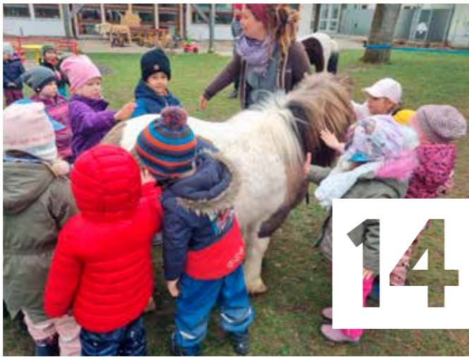
In den städtischen Kinderbetreuungs-einrichtungen wird viel Wert auf lebendiges Spielen und Lernen gelegt.