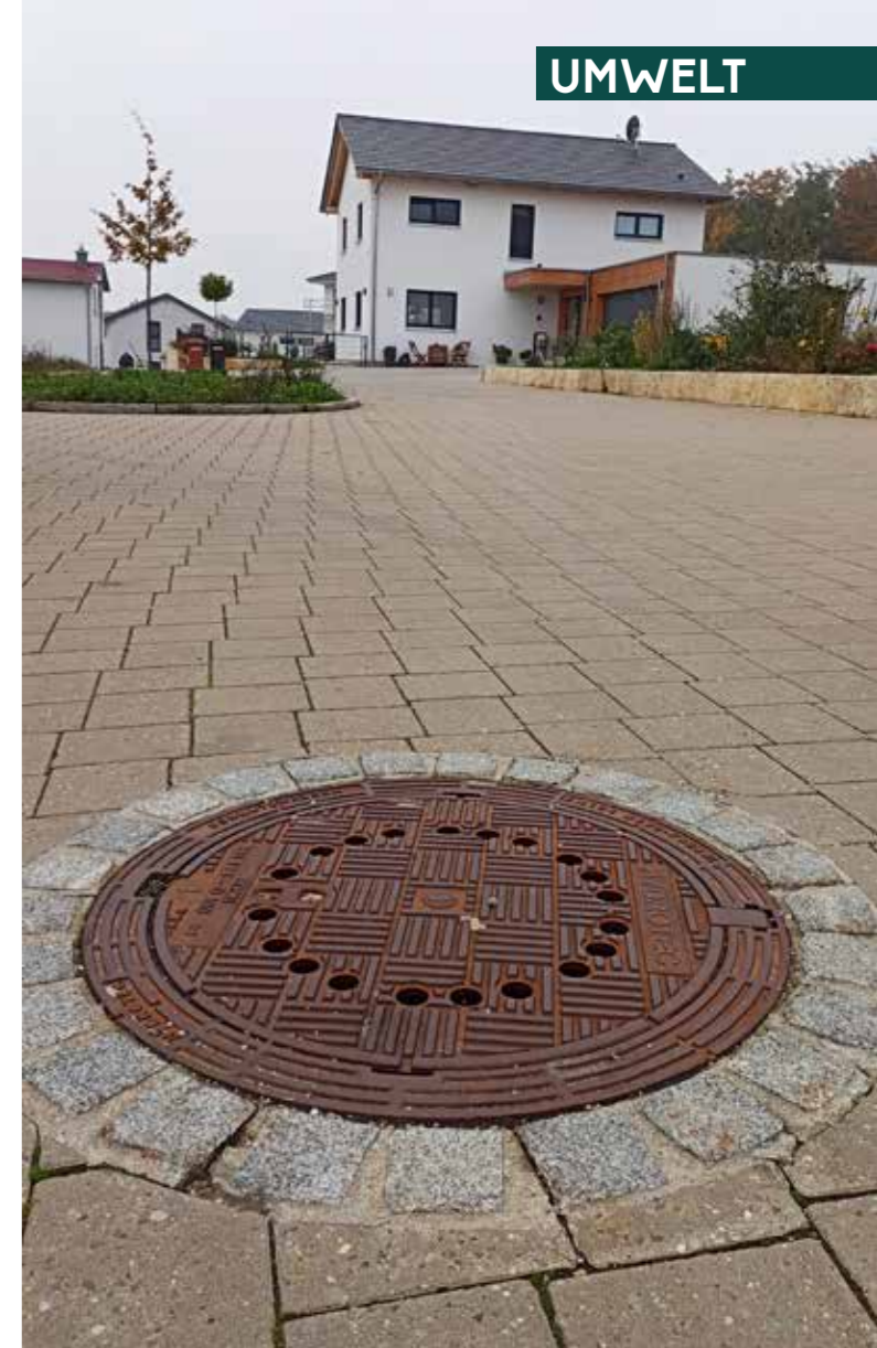
Mit einer wasserdurchlässigen Oberfläche wird das Regenwasser dem Wasserkreislauf wieder zugeführt.

Zusammen mit den Bürgerinnen und Bürgern, die