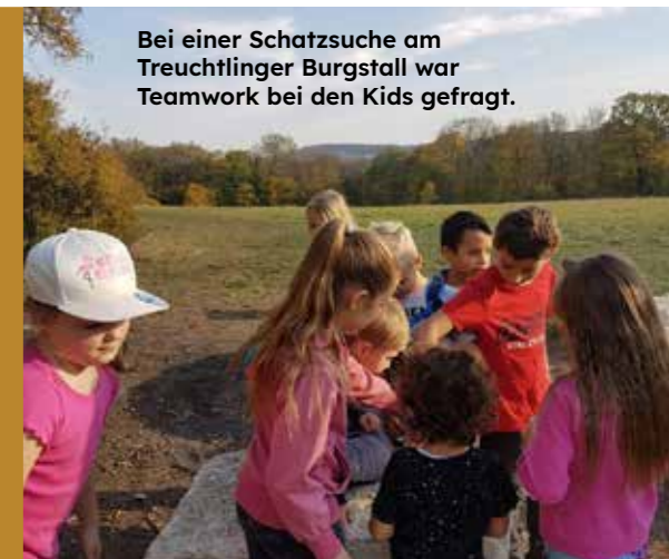
Bei einer Schatzsuche am Treuchtlinger Burgstall war Teamwork bei den Kids gefragt.

Wollt ihr mehr wissen zu den Gruppen oder zum Jugendrat? Dann ruft mich doch einfach an unter 0173 8566930 oder besucht mich in meinem Büro in der „Sene“.