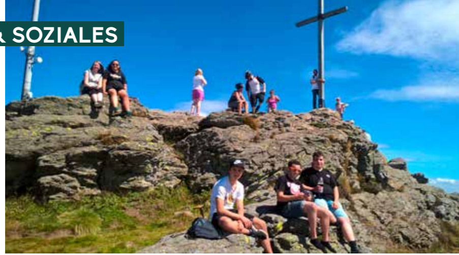
Ausflug in den Bayerischen Wald: Der Jugendrat bestieg gemeinsam den Großen Arber.