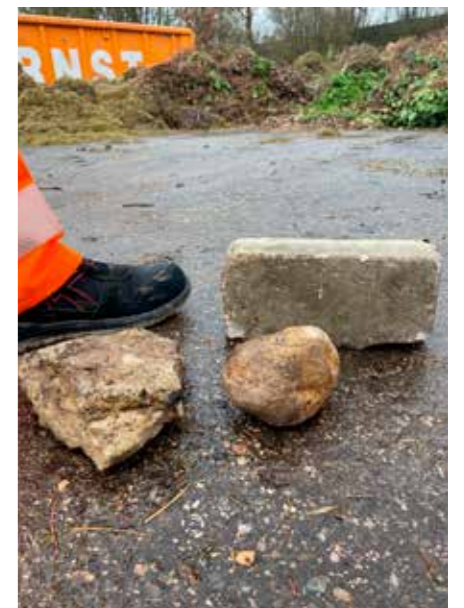
Fremdkörper im Grüngut erschweren die sachgerechte Entsorgung enorm und sorgen für mehr Aufwand und Kosten.

Problematisch bei der Entsorgung von Grüngut ist außerdem, dass immer wieder Steine, Müll und sonstige Fremdkörper unter das Grüngut gemischt werden. Hierdurch entstehen zum Teil immense Schäden an den Maschinen, was wiederum zu Mehraufwand und somit zu Mehrkosten bei der Entsorgung führt. Aus diesem Grund bittet die Stadt Treuchtlingen alle Bürgerinnen und Bürger, das Grüngut vorher zu kontrollieren.