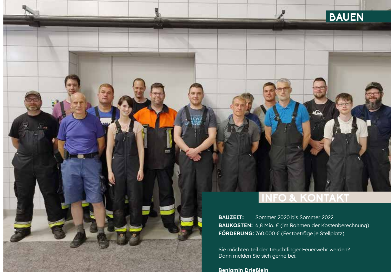
Anfang Mai durften die aktiven Feuerwehrler bereits einen Blick in ihre neuen Räumlichkeiten werfen.