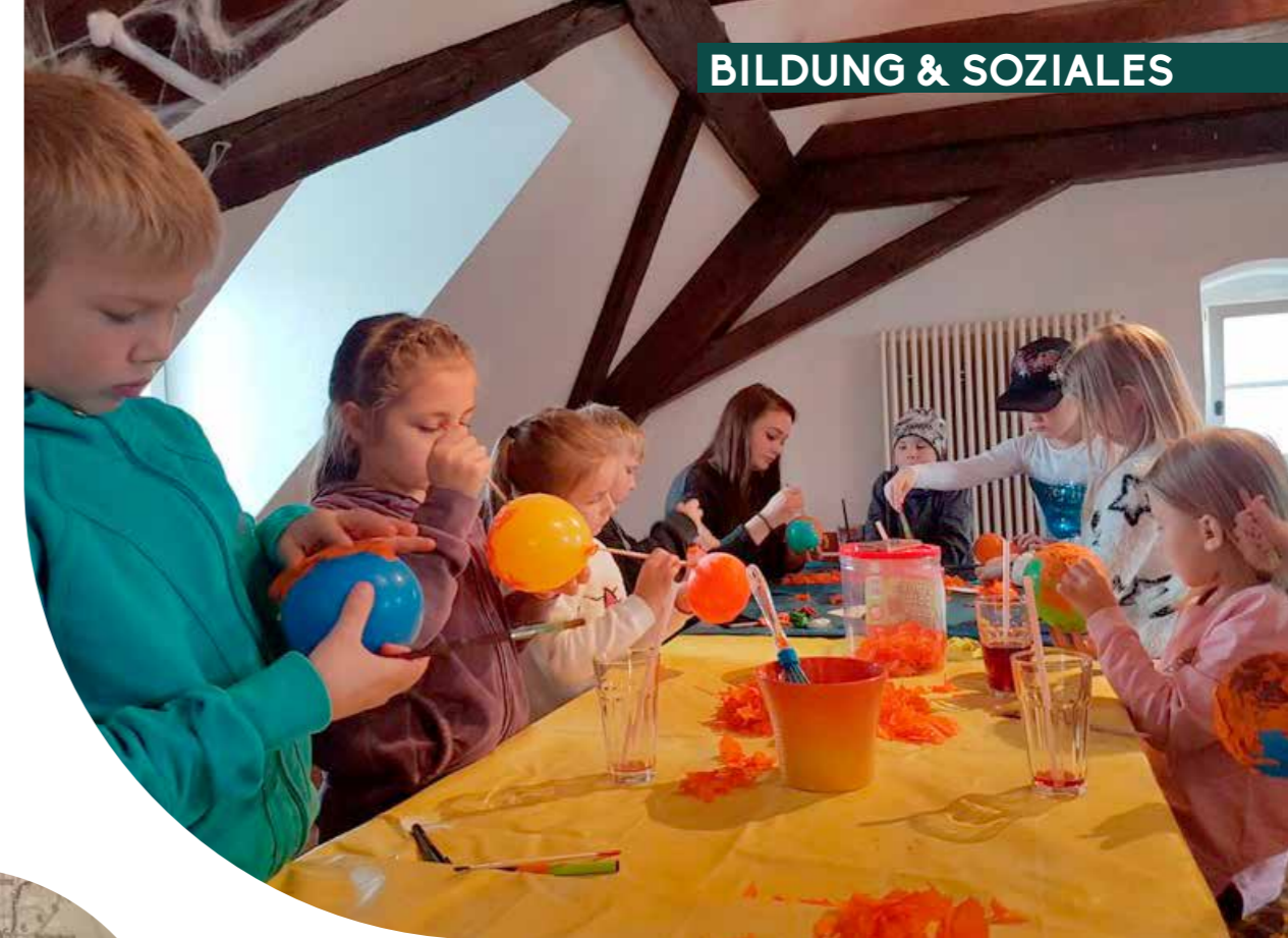
Im JUZ wurden zu Halloween schaurige Gesichter gebastelt.